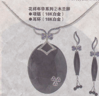
花样年华系列②木兰辞 ● 项链 (18K白金) ● 耳环 (18K白金)