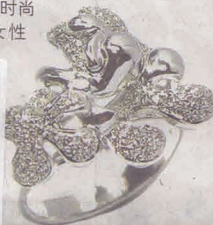
讯息系列 ● 项链 ● 耳环 ● 戒指

YC 18K W 74PD.43 $1,905 HEWF 126 MBR-DR19950