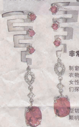
花样年华系列①念奴娇 ● 耳环 (18K白金)