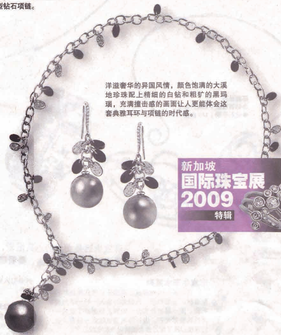
洋溢奢华的异国风情, 颜色饱满的大溪地珍珠配上精细的白钻和粗犷的黑玛瑙, 充满撞击感的画面让人更能体会这套典雅耳环与项链的时代感。

经典的设计永远不会过时, 因此人们对它的追求乐此不疲。“花束系列”的首饰是特别为热爱艺术的品味女性所设计。这一系列的首饰设计主题环绕一朵盛开的花。波浪形状的“花瓣”上洒满了钻石与其他多色宝石, 而“花瓣”上还多加了一层精心雕刻的玫瑰金片。这种种铺陈只为众星拱月地带出一颗明润的南海珍珠。