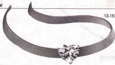
13.16克拉, D色等级, VVS1 GIA认证的心型钻石项链。